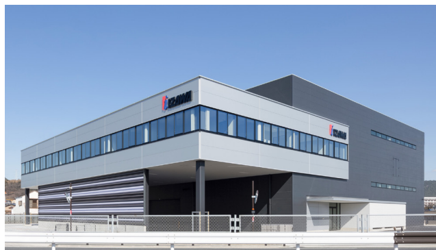
豊橋営業所(2016年新築移転)