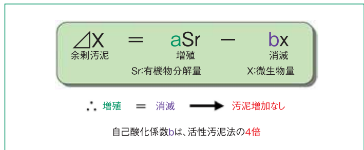
汚泥消滅(微生物の自然の新陳代謝)