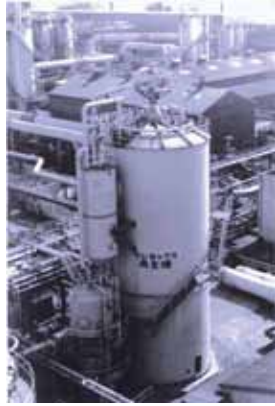
プレミックス方式 再生塔