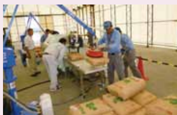
米の全量全袋検査

関経連の皆さまと出会い、「温かい言葉」をいただき心強く感じました。これからも末永いお付き合いをお願いいたします。