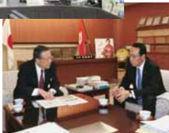
佐藤知事との懇談