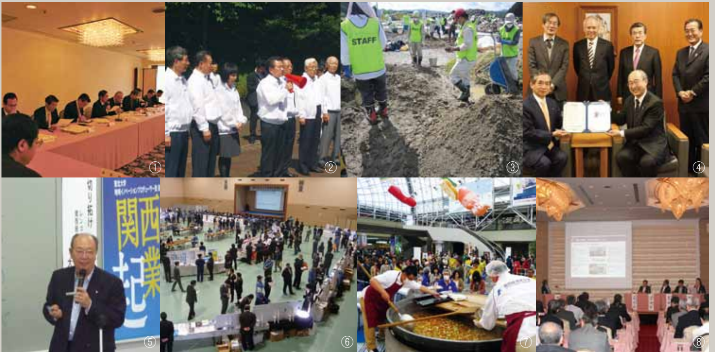
*右下の丸囲み数字は下部年表に対応しています