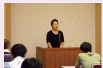
ボランティアバス参加者への講演(2011年9月)

南三陸町では事業所の7割が廃業、今も人口流出に歯止めがかからず、定住人口は簡単には戻りませんので、復興には交流人口の増加が求められています。「千年に一度の災害は、千年に一度の学びの場である」と存じます。多くの皆さまに当地域に足を運んでいただきますよう、心よりお待ち申し上げます。