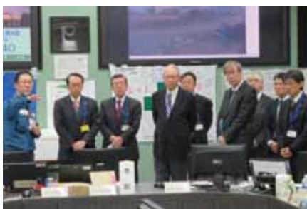
福島第一原子力発電所 免震重要棟内の視察