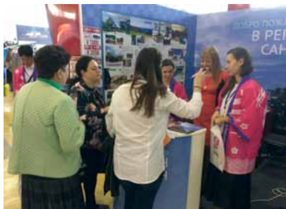
ロシア・ウラジオストクでの旅行博で関西をPR(2017年5月)