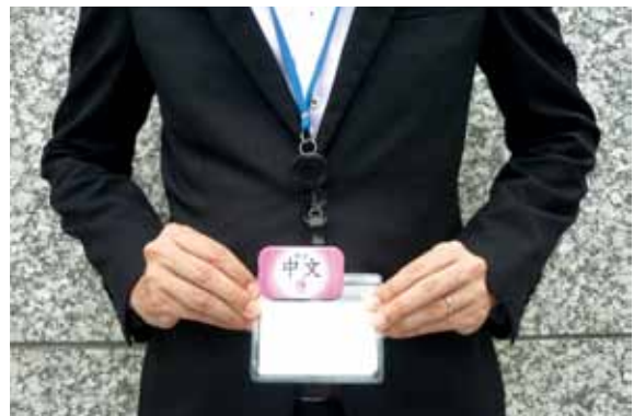
関西おもてなしバッジ着用例