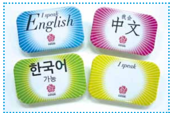
関西おもてなしバッジ

祇園祭(7月14日、15日)、天神祭(7月24日)では関西の大学生や社会人ボランティアの協力によりPRイベントを実施(P.2写真④)。祭りを訪れた外国人旅行者に対し、道案内や簡単な観光案内などを行った。旅行者からは「シンプルだけど分かりやすい、素晴らしい取り組みだ」といった感想が寄せられ、評判は上々だった。