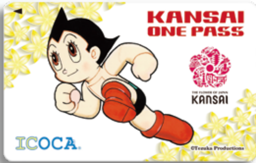
「KANSAI ONE PASS」2,000円券 ©Tezuka Productions

昨年4月から約1年間の試験販売を行っていた、訪日外国人旅行者向け関西統一交通パス「KANSAI ONE PASS」の販売数は約6万枚に上り、利用者からの評価も高かった。そこで好評の声に応え、今年4月17日からは、レギュラー販売に移行。より気軽に購入してもらえるよう、発売額をこれまでの3,000円から2,000円に変更し、2017年度は9万枚の販売をめざしている。