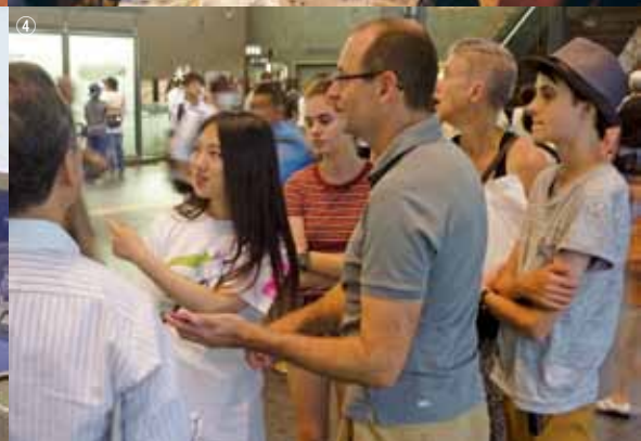
①近畿運輸局と包括連携協定締結 ②オール関西台湾大商談会 ③米国での旅行博出展 ④祇園祭での「関西おもてなしバッジ」PRイベント