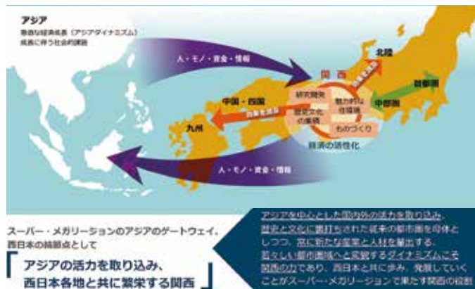
図1 関西のめざす姿

わが国の持続的な経済成長のためには、首都圏とともに関西圏や中部圏が成長エンジンとなり、日本経済をけん引する「複眼型国土構造」の構築が重要である。リニア中央新幹線の開通によって、3つの都市圏がそれぞれの個性を發揮するとともに、相乗効果を生み続けることが、スーパー・メガリージョンの形成・発展、ひいては複眼型国土構造の構築につながるという。