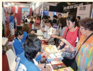
「タイ旅行博2013」でのPRの様子

また、今年の2月14日(木)～17日(日)にタイで開催された、毎年期間中約60万人が訪れる「タイ旅行博(TITF)2013」には、関西地域振