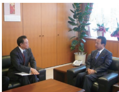
甘利内閣府特命担当大臣