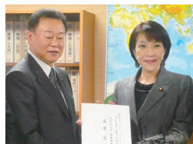
高市自由民主党政務調査会長