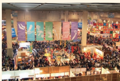
「'09食博覧会・大阪」(前回)の様子

1985年より4年に1度開催され、今年8回目を迎える「食博覧会・大阪」は、日本最大級の食のイベントである(前回(2009年)の来場者数は約65万人)。今回は「食でつながる日本と世界」をテーマに、関西から国内外に「食」ブランドを発信する。