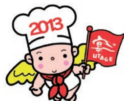
マスコットキャラクター 「フッピー」

☆期間中、当会も東北復興支援の一環として「ワンコインチャリティ 東北3県 郷土ふるまい大鍋イベント(仮称)」を開催します。ぜひお越しください。