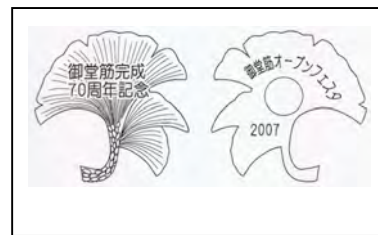
特製「イチョウピンバッジ」イメージ

場 所 : ◎スタンプラリー / 1. 北地区 2. 中地区 3. 南地区① 4. 南地区②