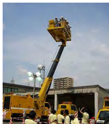
トンネル点検車 （乗車制限あり）