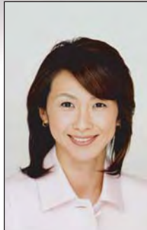
毛利 聡子 フリーアナウンサー