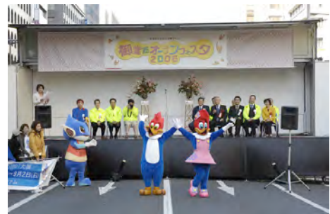
昨年のオープニングセレモニーの様様

実行委員長の關大阪市長の挨拶に始まり、御堂筋完成70周年と世界陸上の特別アピールを行います。