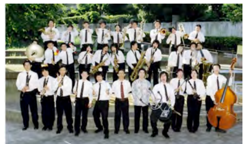
【大阪学院大学吹奏楽部】

御堂筋オープンフェスタ2007の始まりを告げるオープニングセレモニー・パレード。セレモニーに引き続き、大阪学院大学吹奏楽部の先頭で、トラッフィーや各ゾーンのイベント参加者たちが、御堂筋を行進します。華やいだパレードをご期待ください。