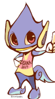
公式マスコット「トラッフィー」

公式マスコット「トラッフィー」によるPR、「I A A F世界陸上2007大阪大会」の見所紹介、クイズ大会等を実施します。