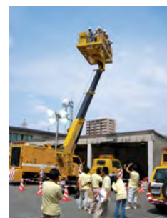
トンネル点検車両