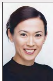
有森 裕子 オリンピックメダリスト