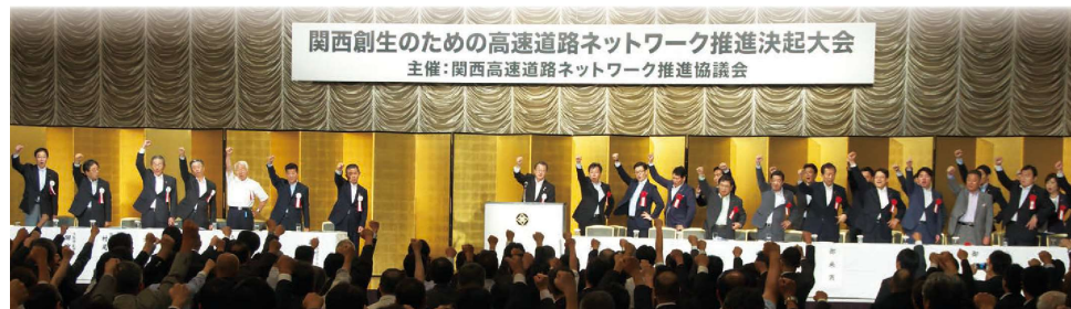
関西創生のための高速道路ネットワーク推進決起大会 主催：関西高速道路ネットワーク推進協議会