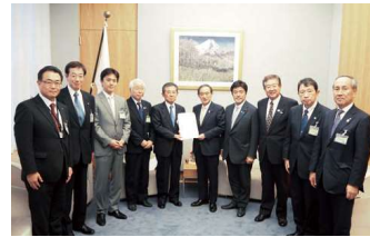
要望活動（2016年11月 於東京都内）

2019年 8月／政府等に対して要望活動を実施（10回目） 10月／政府等に対して要望活動を実施（11回目） 2020年 7月／政府等に対して要望活動を実施（12回目） 9月／政府等に対して要望活動を実施（13回目） 2021年 4月／名神湾岸連絡線新規事業化 7月／政府等に対して要望活動を実施（14回目）