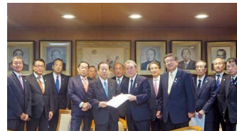
要望活動（2018年1月 於東京都内）