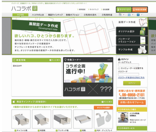
欲しいハコ、ひとつから創ります! ハコラボ http://hacolab.com/

当社は創業から 60 年以上、印刷を中心にさまざまなサービスを提供してまいりました。高度情報化社会が進展していくなか、印刷物の大量生産・大量消費の時代は終わりました。