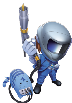
▲当社キャラクター