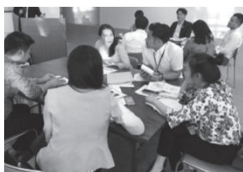
ラオス日本センター「経営塾」 —— 熱心に議論する研修員たち