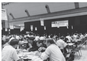
ベトナム日本センター「経営塾」 —— CEO 商談会の模様