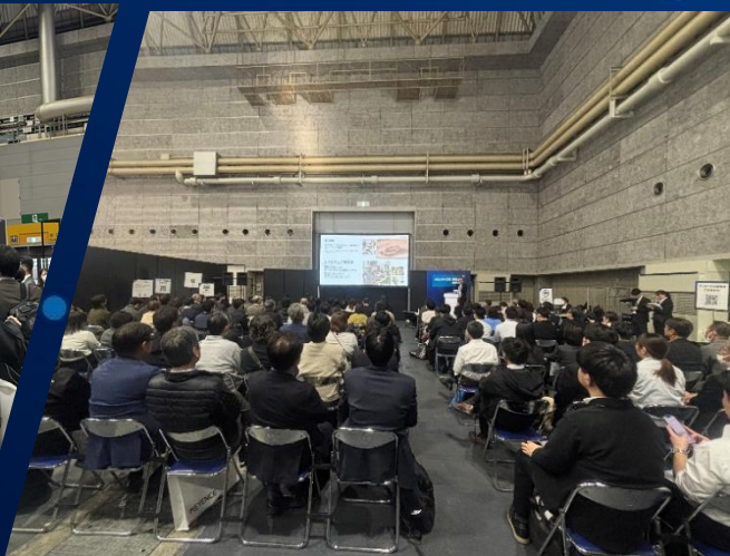
Japan DX Week 2025（大阪会場の様子）