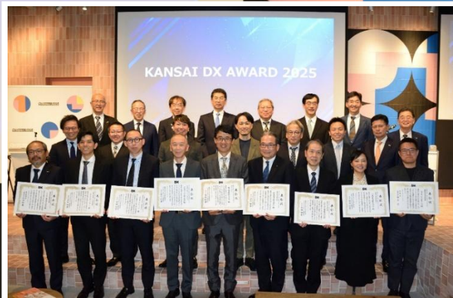
KANSAI DX AWARD 2025 表彰式