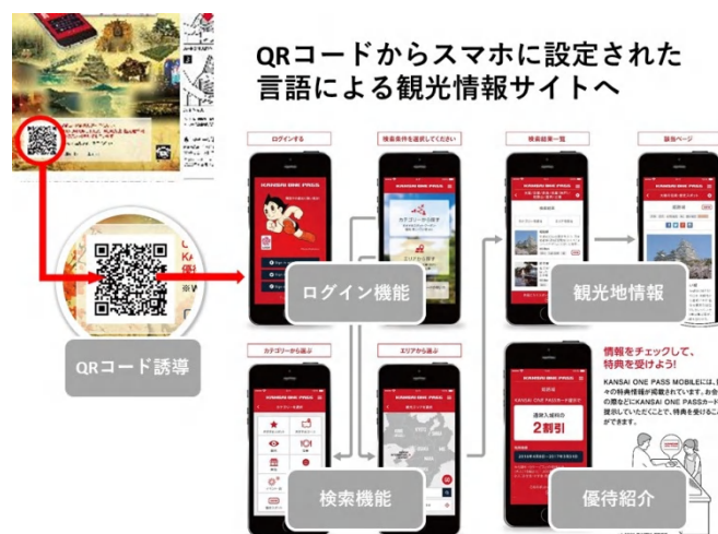
「KANSAI ONE PASS」専用モバイルサイトイメージ