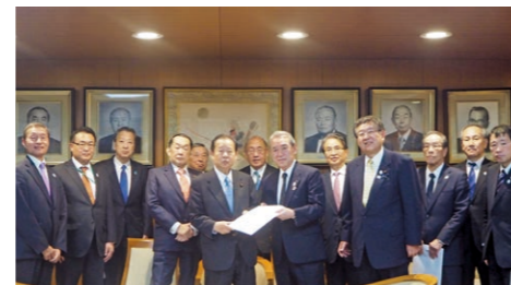
要望活動（2018年1月 於東京都内）