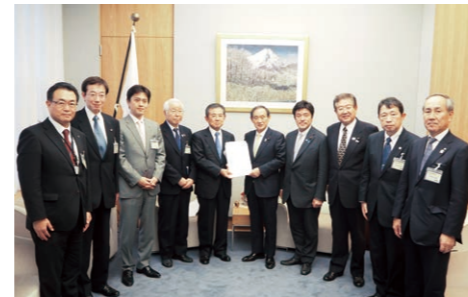
要望活動（2016年11月 於東京都内）