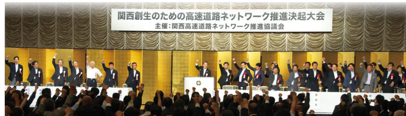
関西創生のための高速道路ネットワーク推進決起大会（2015年6月 於東京都内）

関西経済連合会 〒530-6691 大阪市北区中之島6-2-27 TEL.06-6441-0107（地域連携部） 大阪商工会議所 〒540-0029 大阪市中央区本町橋2-8 TEL.06-6944-6323（地域振興部） 神戸商工会議所 〒650-8543 神戸市中央区港島中町6-1 TEL.078-303-5800（地域政策部） 奈良商工会議所 〒630-8586 奈良市登大路町36-2 TEL.0742-26-6222（業務指導課） 関西経済同友会 〒530-0005 大阪市北区中之島6-2-27 TEL.06-6441-1031（企画調査部）