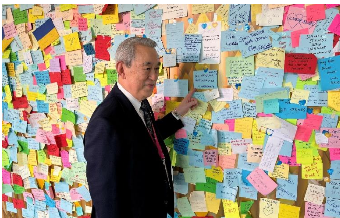
↑ ウクライナ館ではウクライナの人々に向けメッセージを寄せました