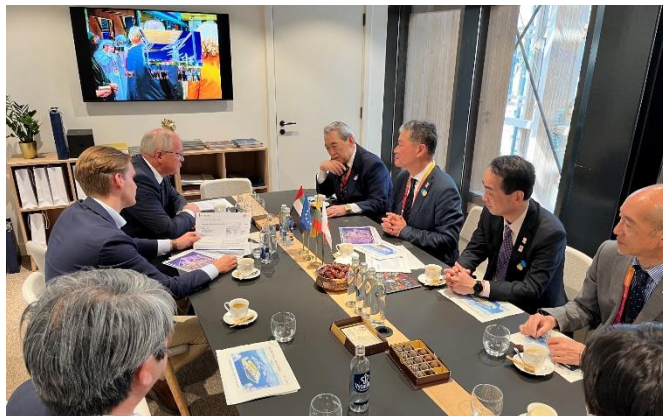
↑ リトアニア・ロマス政府代表との面談の様子